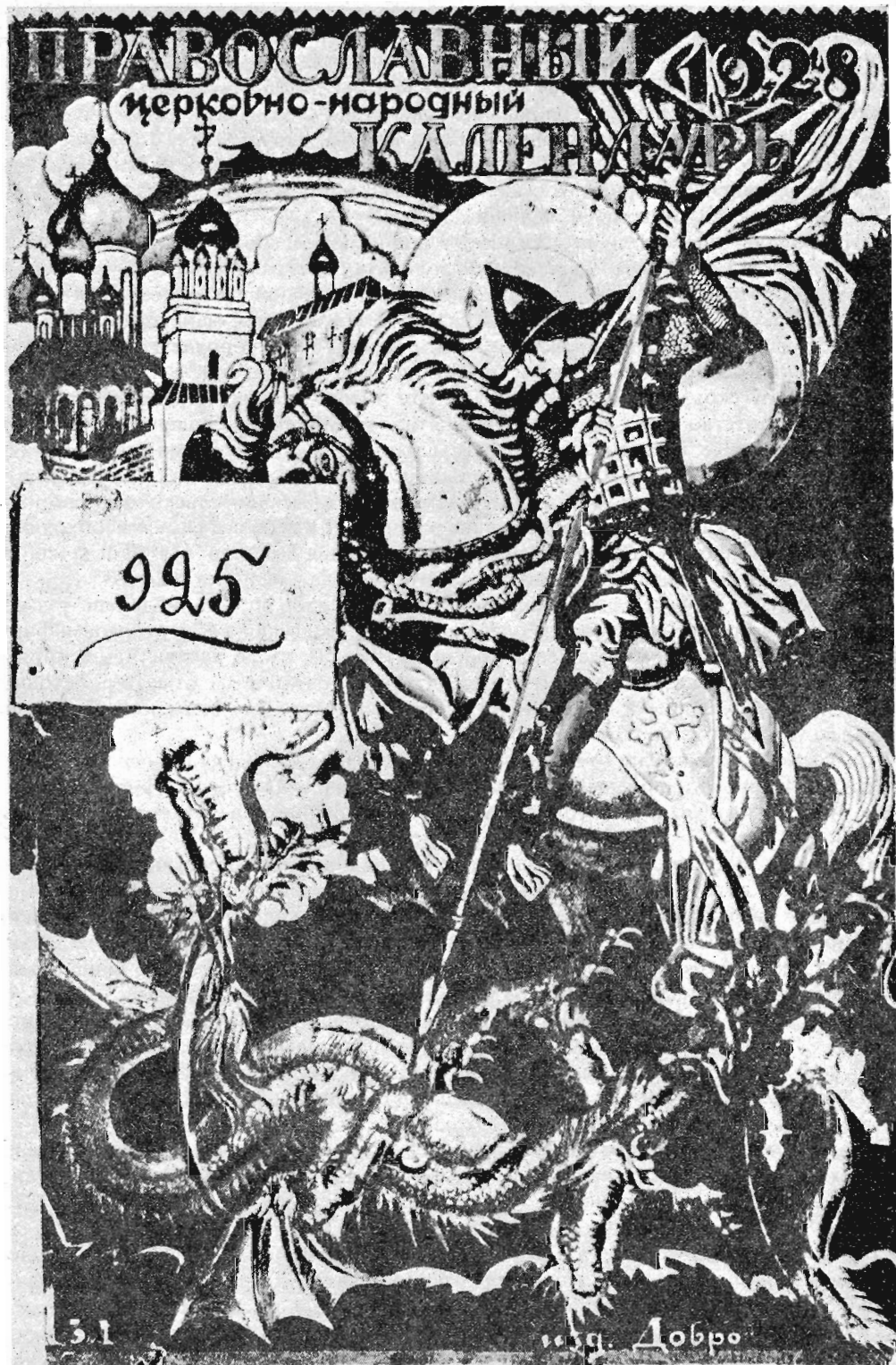
Рис. 2. Обложка "Православного церковно-народного календаря 1928". Варшава, 1927.