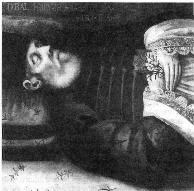
Неизвестный автор. Портрет Georga D. Baltazara Horvatha-Stansitha. 1678 г. Словакия

В православной храмовой живописи на Украине, в Болгарии и Сербии на иконах и фресках со сценами Покрова Богородицы, Богородицы на троне, Богородицы с младенцем, Рождества Христа, Коронавания св. Богородицы со святыми, в некоторых сценах, иллюстрирующих Акафист Богородицы, появляются портретные изображения исторических лиц, что стало возможным благодаря прочно сформировавшейся традиции в византийской живописи (см. ниже).