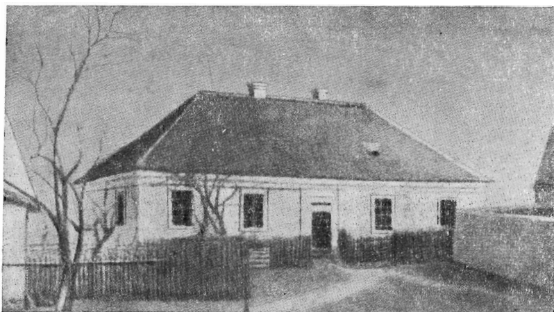
Дом в Бейшти близ Пардубиц, в котором жила семья Э. Направника

прибавить, что дирижировать ему приходилось и многими другими операми...» 6