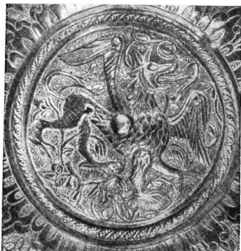
Чаша царя Ивана Васильевича Грозного, 1559 год

История культурных связей Сербии и России в эпоху средневековья богата событиями и памятниками. Связи эти были чрезвычайно многообразны. Они охватывали письменность, литературу, архитектуру, живопись, прикладное искусство. После турецкого завоевания многие сербы находили себе в России вторую родину. Неизменно из России в Сербию шла помощь материальная и духовная: посылались щедрые пожертвования, книги, произведения искусства. Они сосредоточивались главным образом в монастырях — почти единственных очагах культуры сербского народа в тяжелые годы турецкого ига. Среди таких монастырей особенно выделялся Милешевский Вознесенский монастырь на юго-западе страны. Он был основан около 1234 г. королем Владиславом. Собор монастыря расписан великолепными всемирно-известными фресками. В исто-