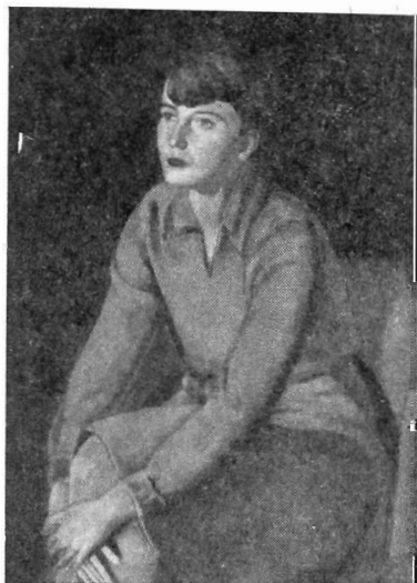
Портрет Е. Ш. х. м.

Первый удачный опыт — вышедшее недавно в свет двухтомное издание «Ки-