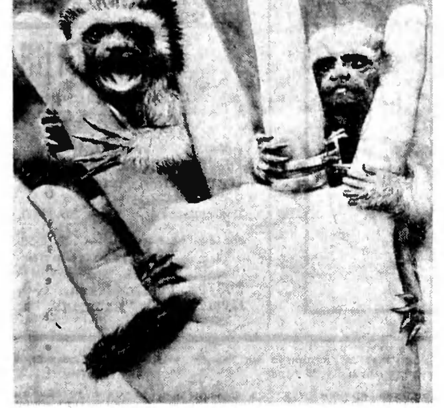
Эти миниатюрные обезьянки, родившиеся в Норфолке (Англия), считаются одними из самых крошечных представителей приматов в мире. Им всего три недели от роду, а рост не превышает 3 дюймов (чуть больше 7 сантиметров). Служители Килверстонского парка-заповедника вскорости их из бутылочек кормят молоком. Обычным местом обитания этой разновидности обезьян, живущих на деревьях, являются леса Колумбии.

В. МИХЕЕВ, соб. корр. «Известий», СИДНЕЙ.