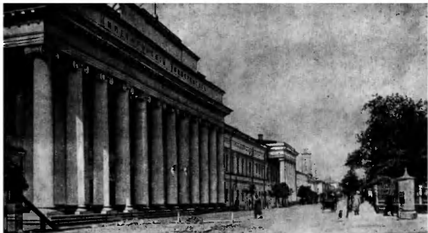
Казанский императорский университет. 80-е годы XIX века.