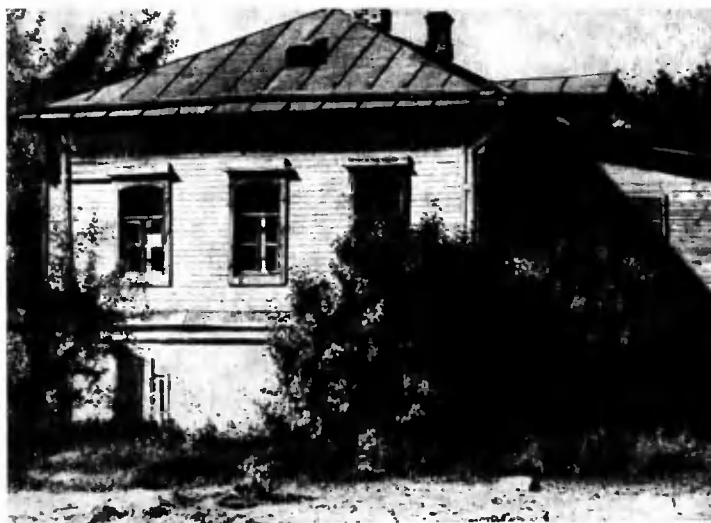
Флигель, в котором жила семья Ульяновых в 1869—1870 годах и где родился Владимир Ульянов.