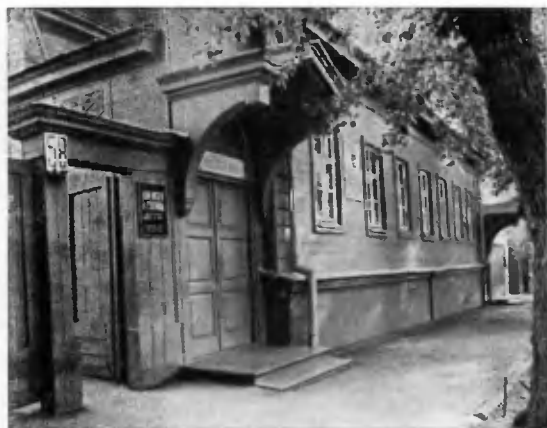
Дорожка, ведущая к Дому-музею В. И. Ленина. Ульяновск.