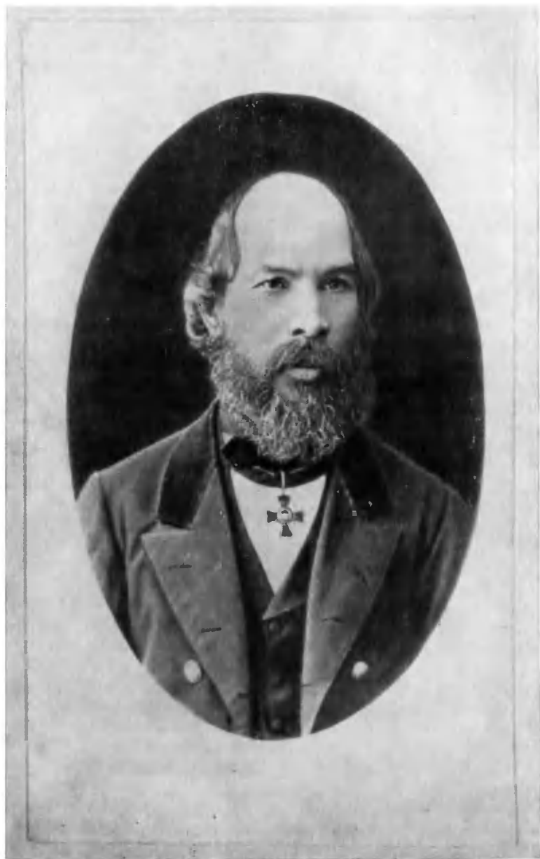
И. Н. Ульянов. Симбирск, 1872 г.