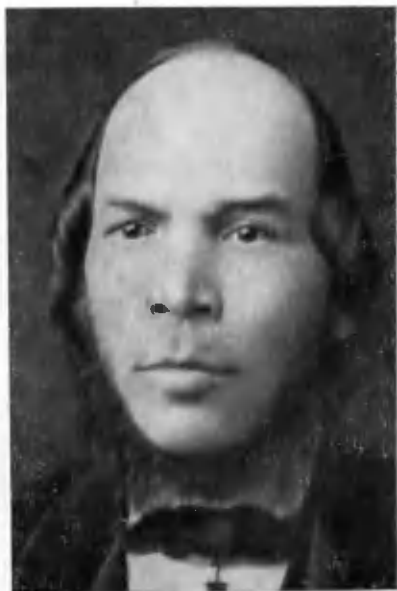
И. Н. Ульянов. Симбирск, 1874 г.