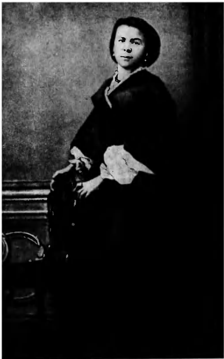
М. А. Ульянова. Пенза, 1863 г.