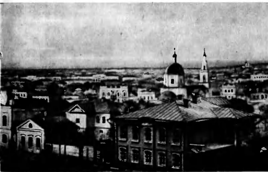
Диорама Симбирска. 70-е годы XIX века.