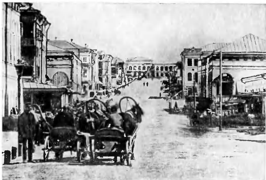
Симбирск. Дворцовая улица. Конец XIX века.