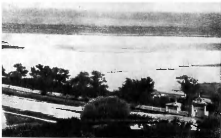
Симбирск. Вид на Волгу.