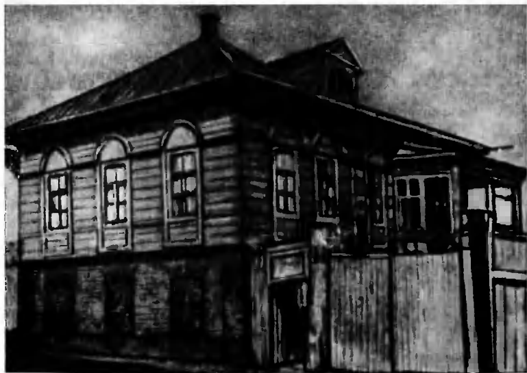
Домик Ульяновых в Астрахани.