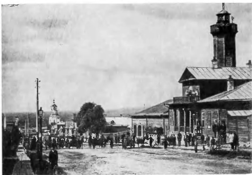
Московская улица Симбирска. 90-е годы.

Здание бывшего женского приходского училища, открытого И. Н. Ульяновым.