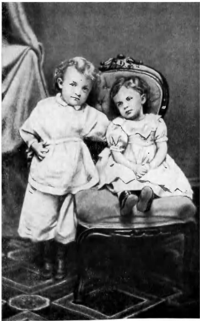
Володя и Оля Ульяновы. Симбирск, 1874 г.