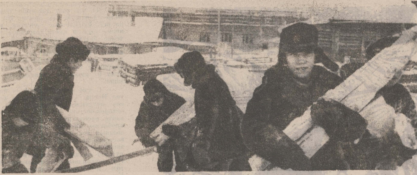
В посёлке Аксарка Тюменской области сооружают новую больницу. После уроков на помощь строителям приходят ученики Аксарковской школы-интерната.