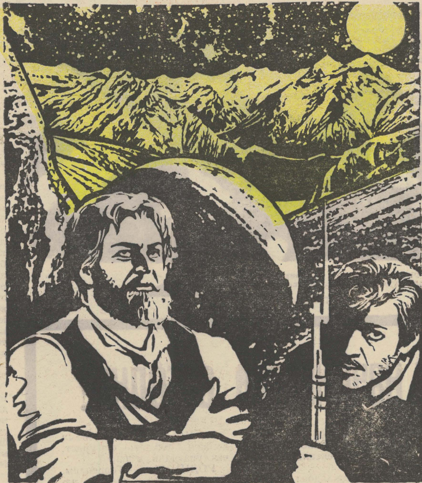
Рис. Игоря ВЛИЮХА

Продолжение. Начало см. «Пионерскую правду» №№ 6, 8, 9, 11.