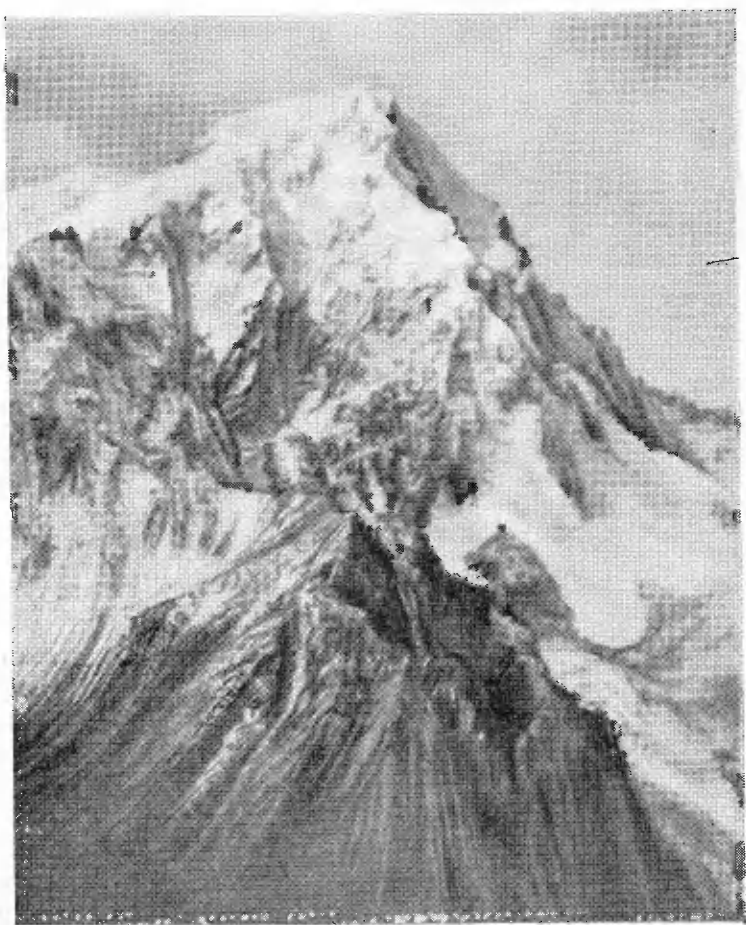
Восточный Гиндукуш. Гора Тирадж-Мир — 7770 м.