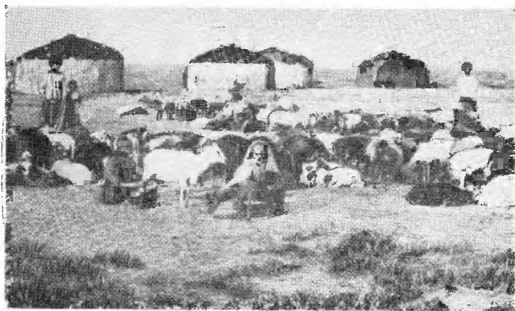
Кочевья туркмен в районе Меймене.