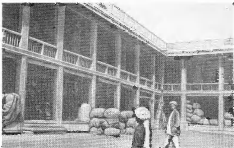
Караван-сарай в Кабуле.