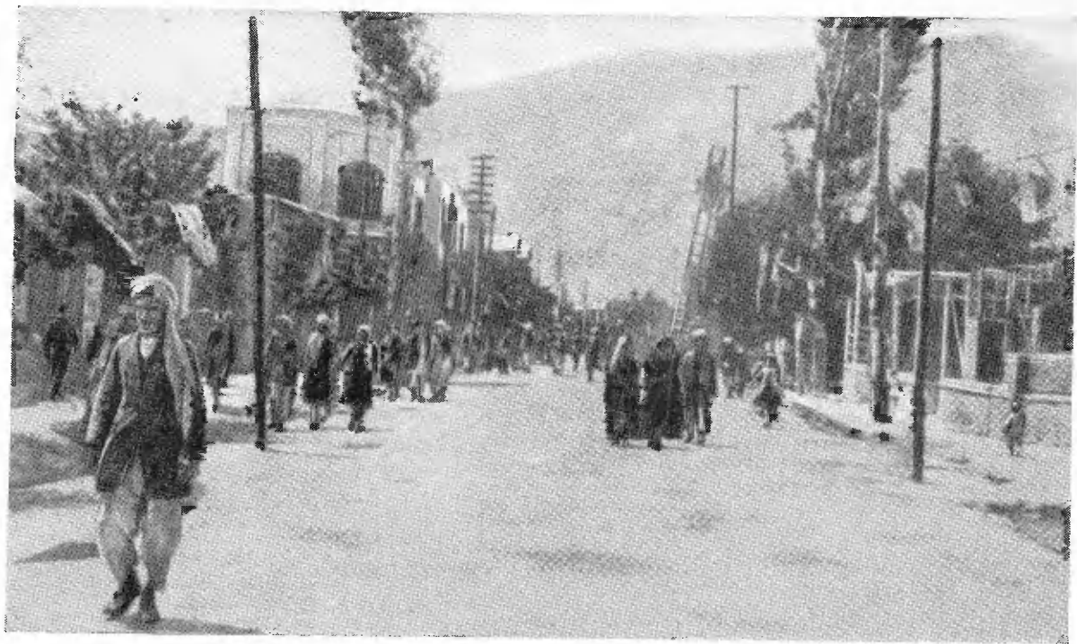
Главная улица Кабула.