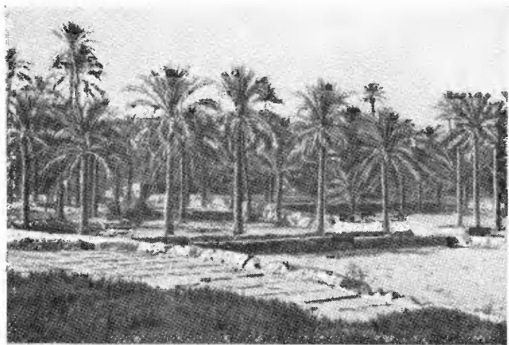
Финиковая роща в районе Джелалабада.