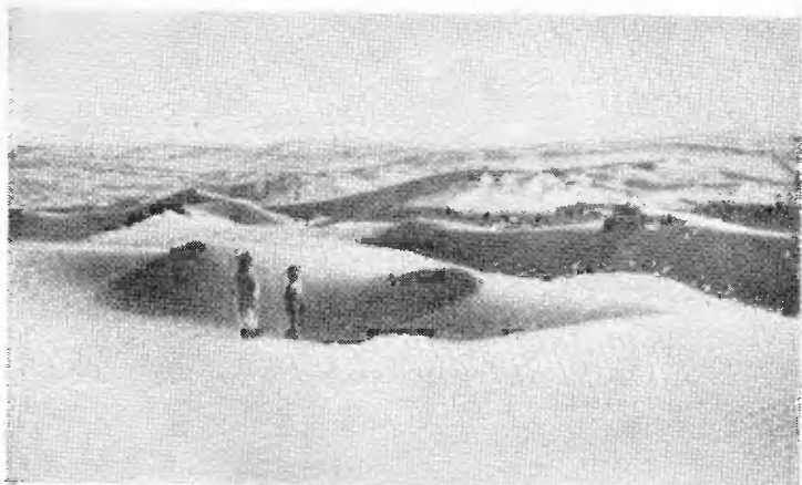
Барханные пески в афганской пустыне.