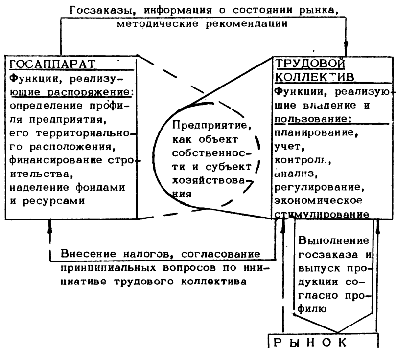
Рис. 1. Схема реализации отношений собственности в государственном секторе

пределении дохода. Согласно приведенной схеме взаимодействия госаппарата и коллектива предприятия распределение хозрасчетного дохода осуществляется следующим образом (рис. 2).